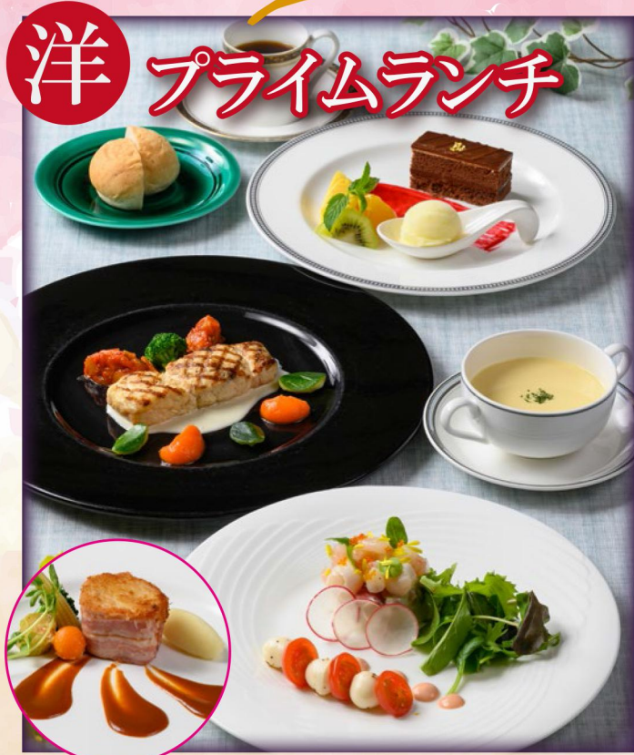
※和・洋ともに写真の料理は一例です。季節や仕入れ状況により内容は異なります。